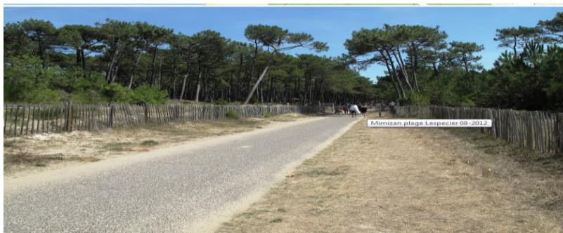
Accès à la plage

Le parking est situé sous les pins. L'accès à la plage se fait par une piste « en dur ».